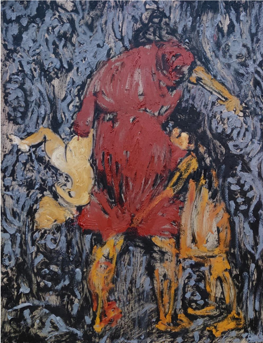
6. „За да спаси голямата дъщеря от глад, майката закла по-малката“, 220 x 160 см, м.б., пл.

Бузиян Елена Григориевна (родена 1938 г.) в село Остривне (Одеска област) си спомня: